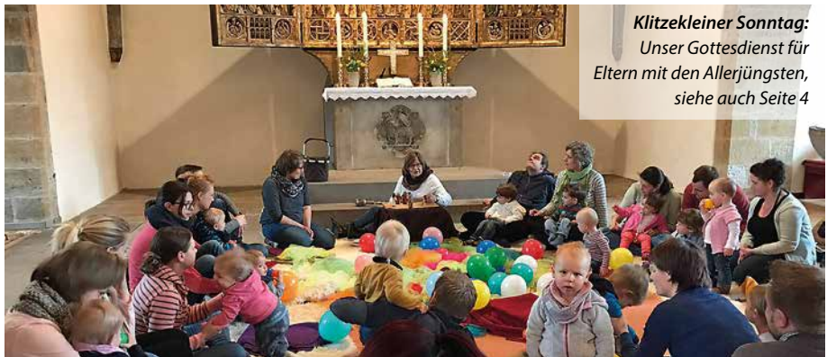
Klitzkleiner Sonntag: Unser Gottesdienst für Eltern mit den Allerjüngsten, siehe auch Seite 4