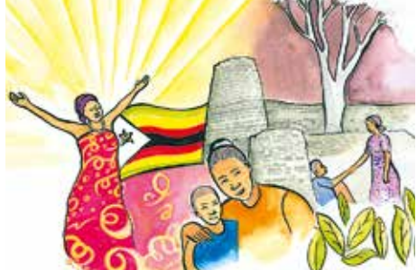
Abbildung: Nonhlanhla Mathe

Veröffentlichung und Widerspruchsrecht Impressum 27