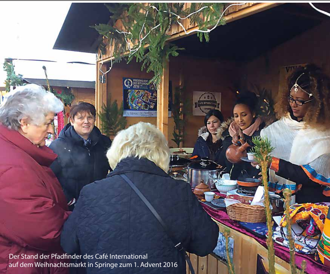
Der Stand der Pfadfinder des Café International auf dem Weihnachtsmarkt in Springe zum 1. Advent 2016