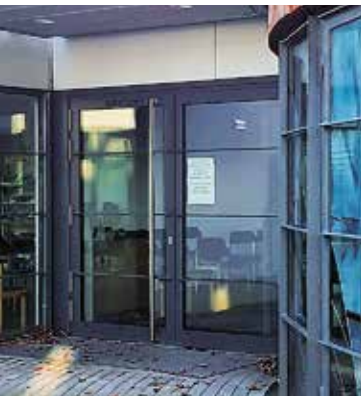
1. Eingangstür Kirche

Bettina Bartke, Pn und Marianne Fröstl, KV