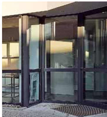
2. Eingangstür Gemeindehausfoyer