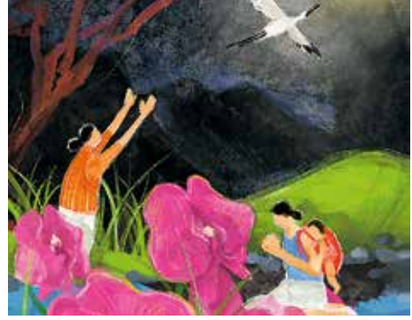
Abbildung: Hui-Wen Hsiao / World Day of Prayer International Committee Inc., 2021

J.S. Bach, Quodlibets, engl. Weihnachten 28