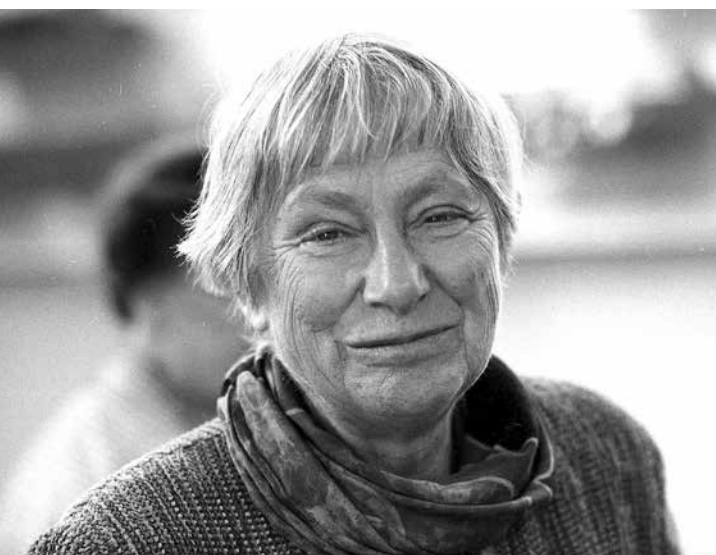
Dorothee Sölle 1989