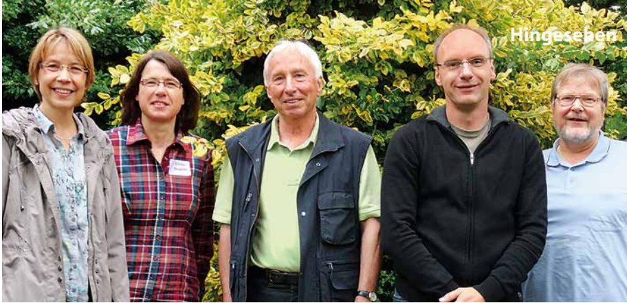
Unser Kirchenvorstand bei seiner Klausur in Loccum 2013