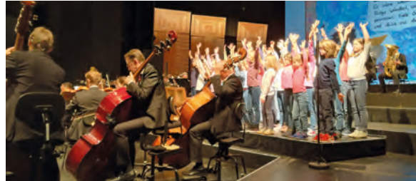
Der Quilisma-Kinderchor beim Kinderkonzert der Staatsoper Hannover

können. Auch für das leibliche Wohl wird gesorgt!